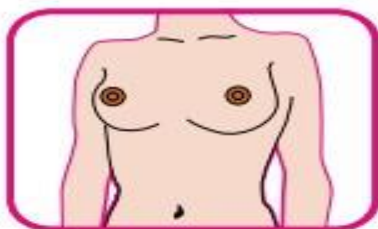
Feridas que não cicatrizam e coceiras que não melhoram