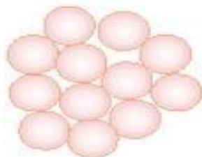
1. Células normais