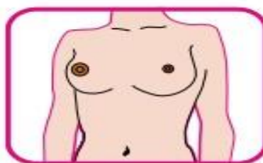
Áreas estufadas (abaulamento) e covinha (retração)