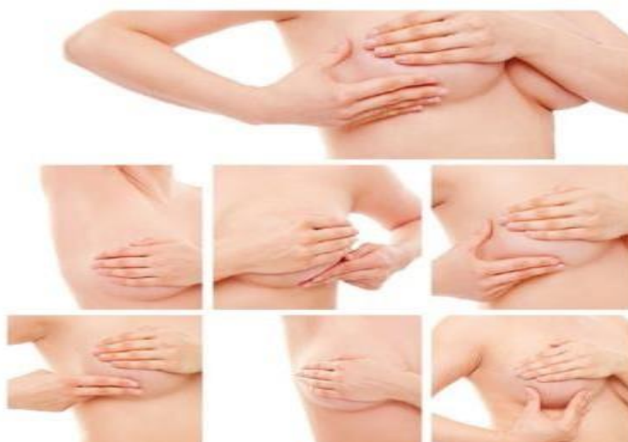
Imagem reproduzida da cartilha “o que você precisa saber sobre o câncer de mama”, da Sociedade Brasileira de Mastologia.