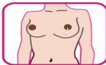
Saída de líquido do bico do peito (sem apertar) de cor vermelha ou transparente como a água