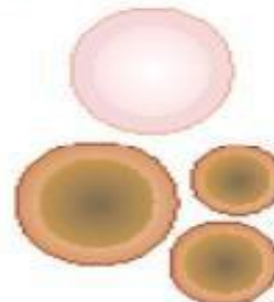
3. Célula doente