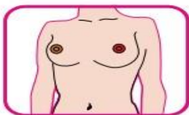
Vermelhidão e pele endurecida

Na maioria dos casos, o câncer se manifesta com um caroço na mama, mas também pode se apresentar de outras formas: