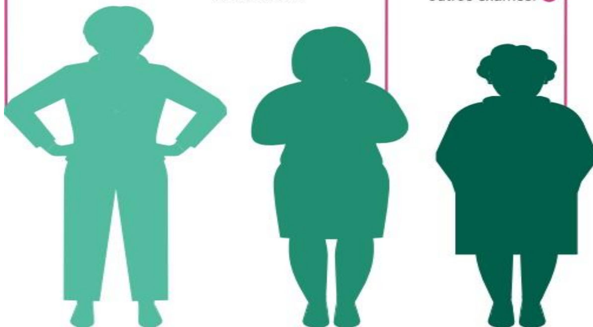
Imagem reproduzida da cartilha "o que você precisa saber sobre o câncer de mama", da Sociedade Brasileira de Mastologia.

A recomendação é realizar a mamografia até os 69 anos. Em caso de suspeita, em qualquer idade, a mulher deverá fazer outros exames.