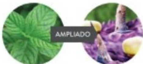
Bolsa de Óleo da folha de Hortelã-pimenta