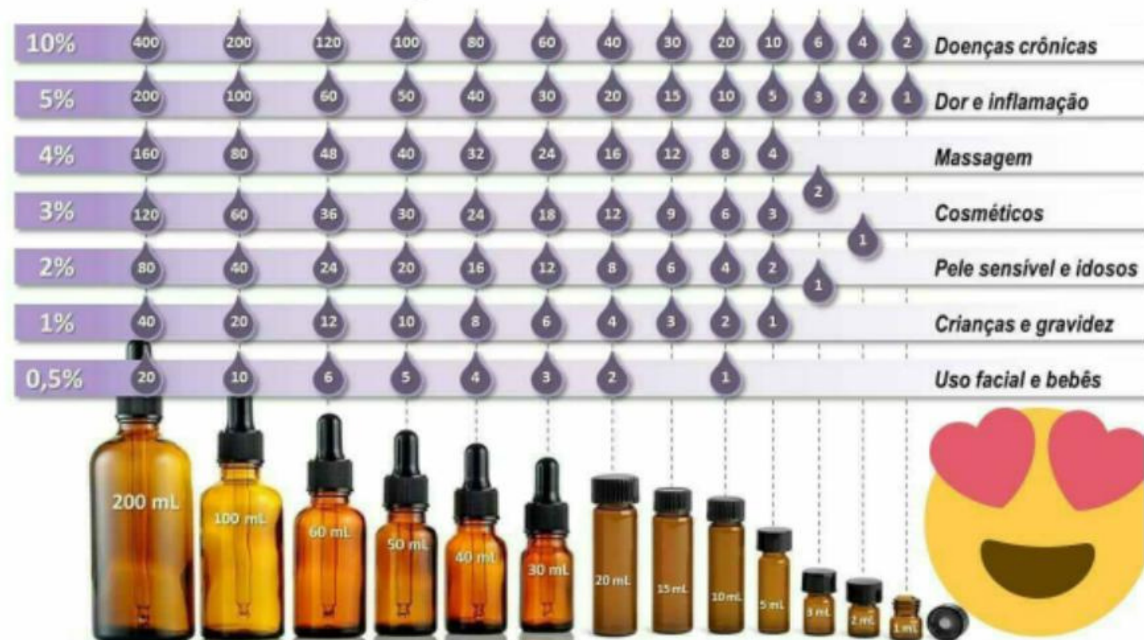
TABELA DE DILUIÇÃO